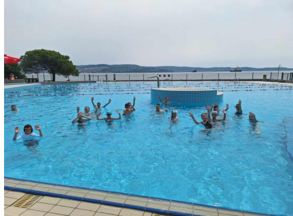
Učenke in učenci 5. razredov