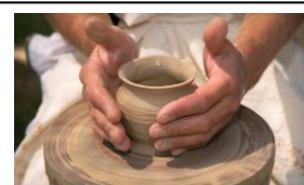
Na sliki: lončarsko vreteno

5. Oglej si slike in pod vsako zapiši, katero prevozno sredstvo prikazuje ter kaj je poganjalo predmet na sliki.