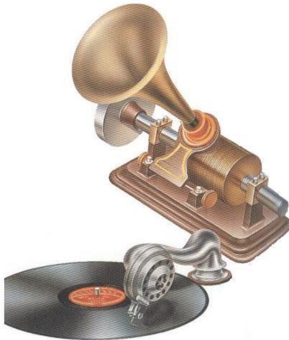
Slika 1: Fonograf

K filmu je zelo veliko prispeval Thomas Alva Edison, ki je leto pred nastankom filma izumil prvi kinoskop. Nekaj let pred tem pa je izumil napravo za snemanje zvoka – fonograf ter žarnico. Sicer pa je bila za predvajanje filma potrebna elektrika, ki pa jo je iznašel Nikola Tesla.